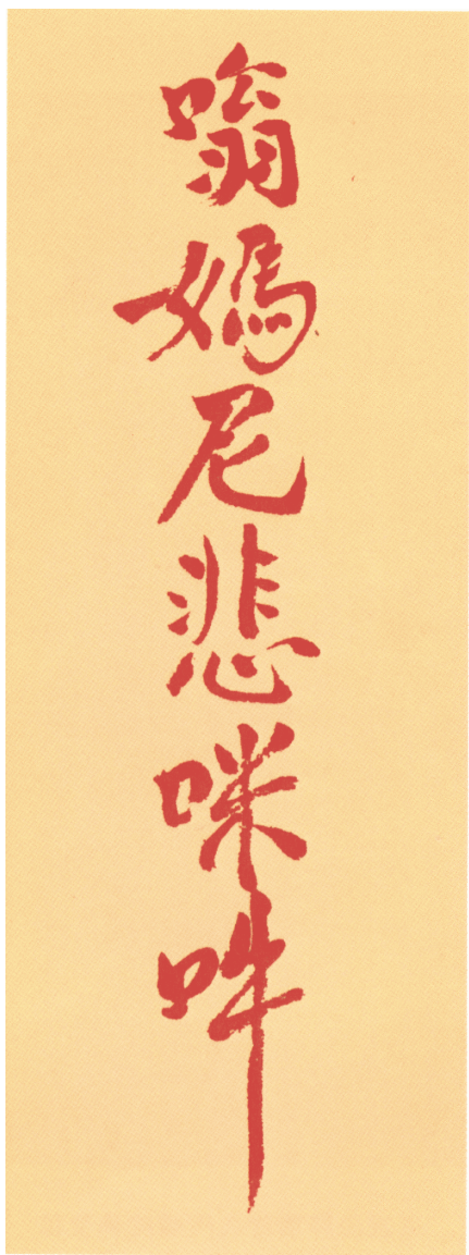
林居士手書六字大明符