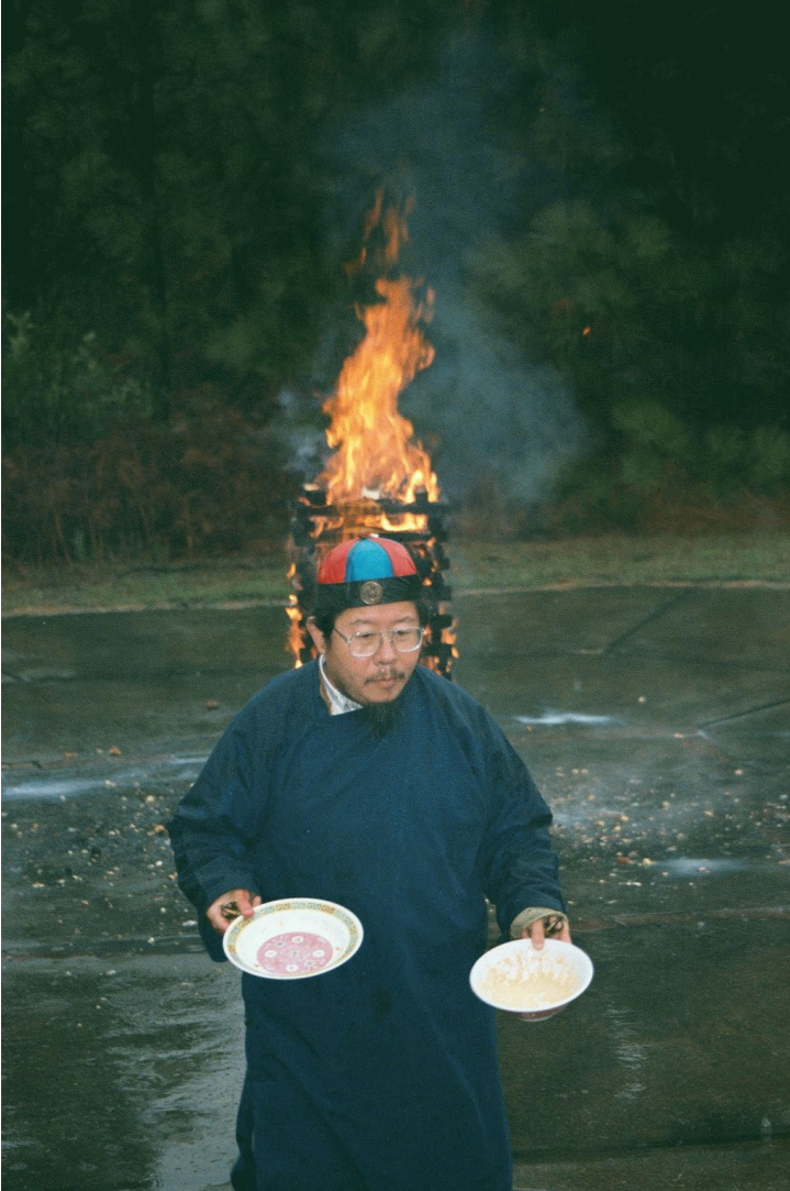
文殊火供示現之觀音聖像