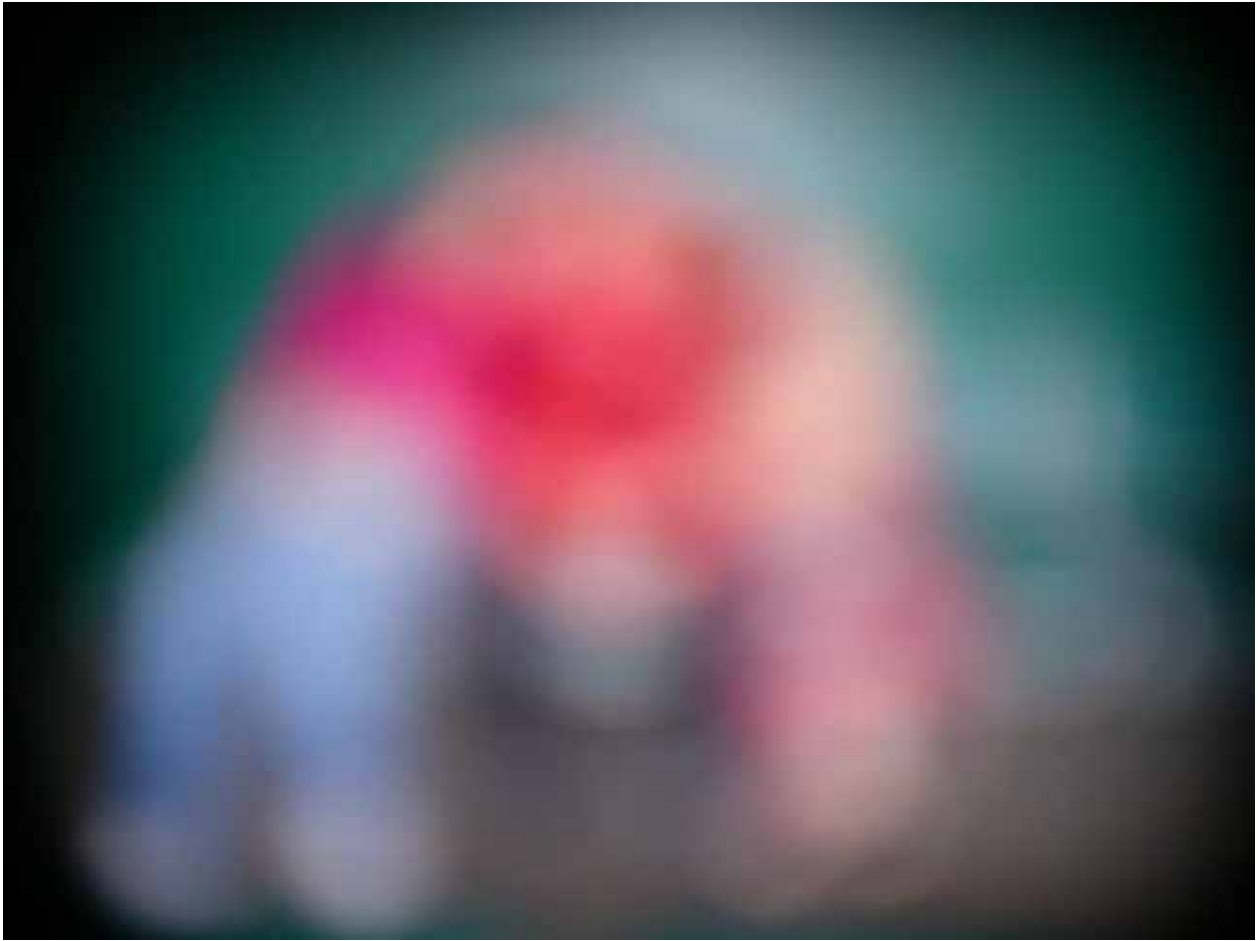
(師佛和弟子融為一體放光照第 2 張)