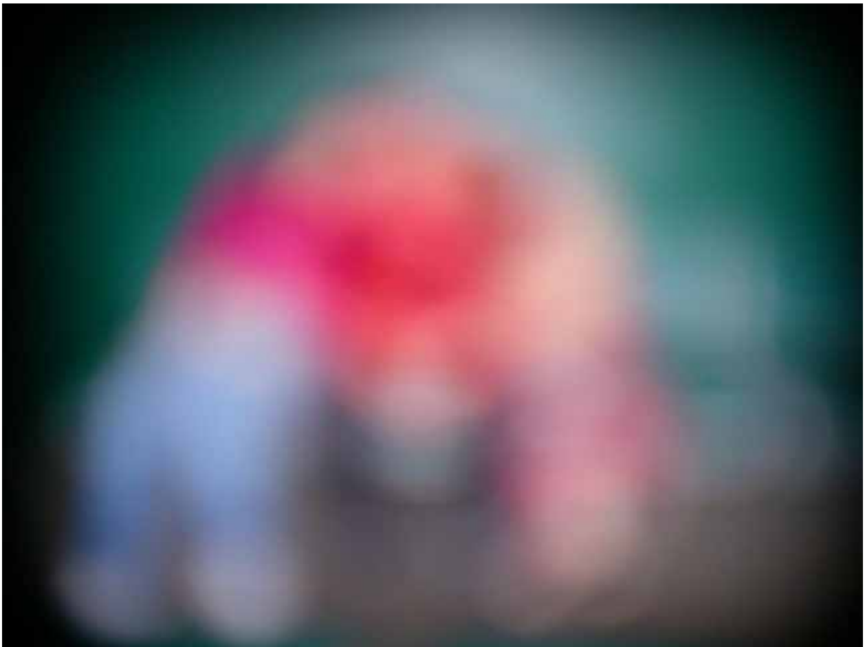
(師佛和弟子融為一體放光照第 3 張)