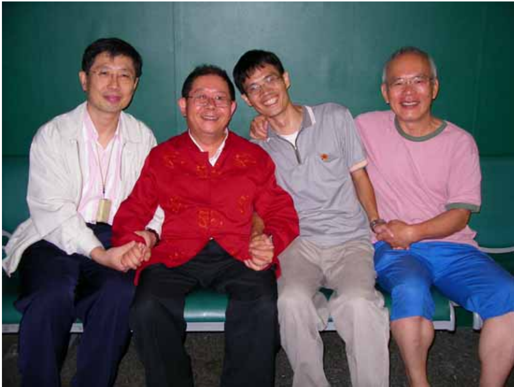
(羨慕吧!有更令人羨慕的)

27 號晚上和師兄姐到機場送師，那段時時光真是令人回味無窮，照片已傳給 Detong，會上傳分享给大家。記得當時已接近師佛登機的時間，每個人都把握時間和師佛握手以領加持。