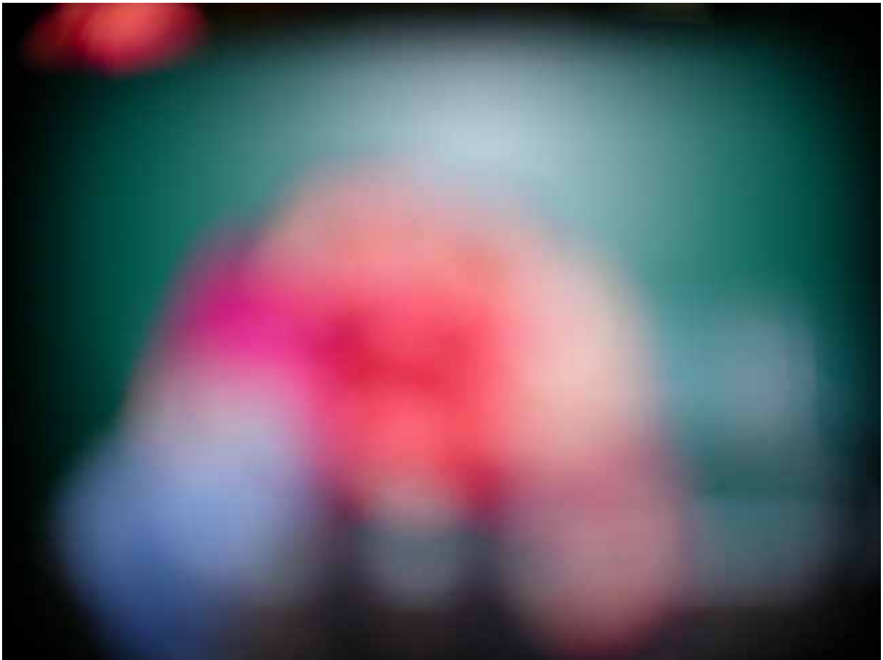
(師佛和弟子融為一體放光照第 5 張)